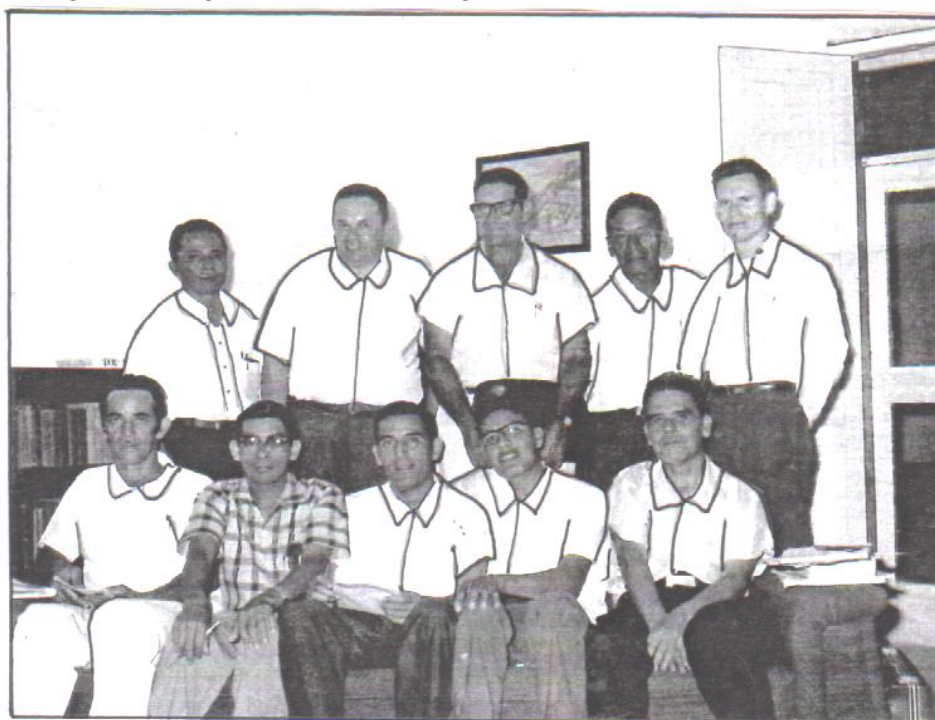
F. 106, Comisión Permanente en 1970. (Retoque EAM)

Inmediatamente un día después de la independencia, los representantes de las Iglesia Amigos de los tres países: Guatemala, Honduras y El Salvador, acordaron que la Junta Anual recién organizada se llamaría “Iglesias Evangélicas Amigos de Centroamérica” (Acta No. 2, punto octavo, Junta Anual, 4 de noviembre, 1970). Dos años después, o sea, en 1972, se consideró que este nombre era muy largo. Por lo mismo, fue cambiado, quedando como “Junta Anual “Amigos” de Centroamérica” (Acta No. 13, punto cuarto, Junta Anual, 31 de octubre, 1972). Este nombre permaneció así, hasta que la Junta Anual de Honduras y de El Salvador se independizaron de Guatemala. Actualmente, a la Junta Anual de Guatemala, se le conoce con el nombre de “Iglesia Evangélica Nacional “Amigos” de Guatemala.