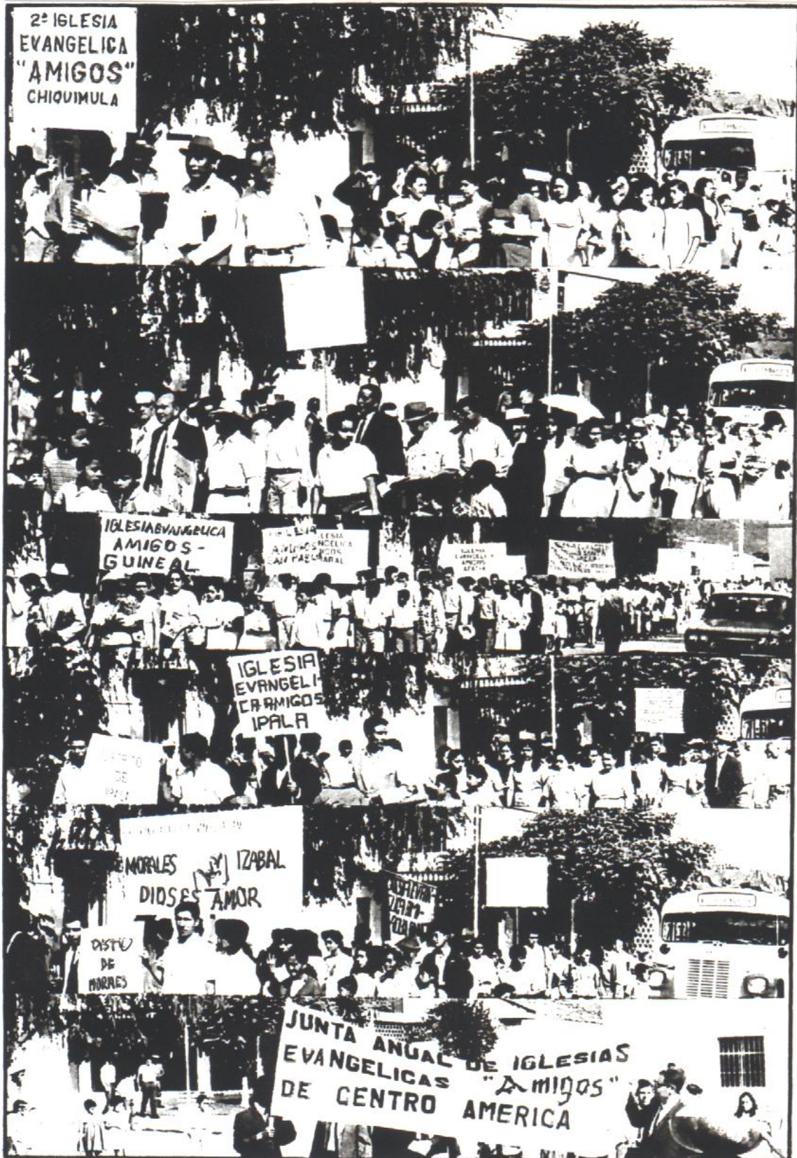
F. 105, Desfile de Iglesias, conmemorando la independencia de la Junta Anual.

A partir de entonces, la Junta Anual "Amigos" de Centroamérica, quedó en libertad de marchar por sí misma, en su propio camino. Se esperaba, entonces, que asumiera la