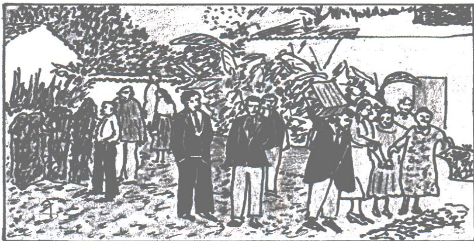
F. 65, Grupo saliendo hacia una campaña. (Dibujo EAM)

En el año 1934, fueron abiertas las puertas a los caídos. Ante los varios avivamientos y campañas frecuentes, muchos de ellos comenzaron a buscar otra vez al Señor. Al mismo tiempo, el avivamiento era general en la salvación de las almas. La oración, tomó un lugar importante en las vidas de los creyentes, de modo que, había grupos orando mañana, tarde y noche. Muchos evangelistas, hombres y mujeres, recorrían diversos lugares predicando. Las conferencias, en los distintos lugares, también iban siendo cada día de mayor importancia. Las conferencias de Chiquimula, ese año, tuvieron la mayor asistencia en la historia, y los creyentes seguían creciendo en número. A mediados de 1935, se podían contar 4,326 creyentes. En este año, se hizo necesario imprimir 8,400 ejemplares de la 6ª edición del himnario “Corazón y Vida”. Cada día era más grande la demanda, conforme el número de creyentes se multiplicaba (“The Hárvester”, junio, 1935, p. 5-6).